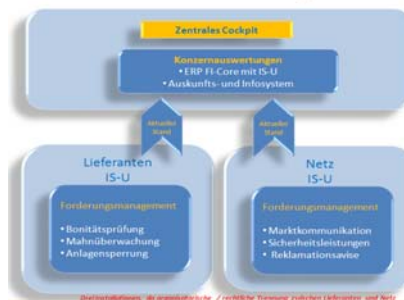
Getrennte Systemlandschaft Zentral oder als Inselösungen

Systemabstimmung, Abgrenzbarkeit / rechtliche Trennung zwischen Lieferanten und Netz